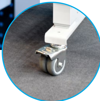
Fahrbar dank Lenkrollen