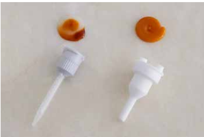
Vergleich: Mischergebnis statische Mischung (links), dynamische Mischung (rechts)

Ergebnis: Der 2-komponentige Epoxid Klebstoff, der per statischer Mischung nicht verarbeitet werden konnte, ist per dynamischer Mischung bereits bei der kleinsten Mischerdrehzahl zuverlässig durchmischt und kann optimal verarbeitet werden.