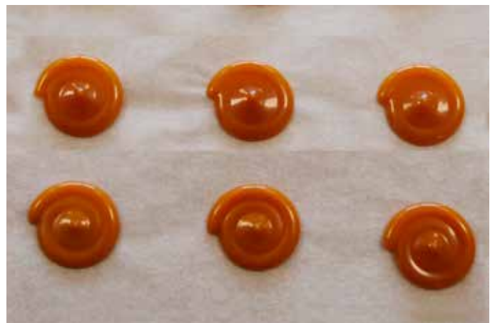
Mischergebnis eco-DUOMIX (dynamische Mischung)